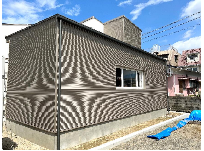
ガルバリウム鋼板